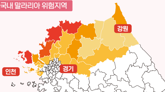
국내 말라리아 위험지역