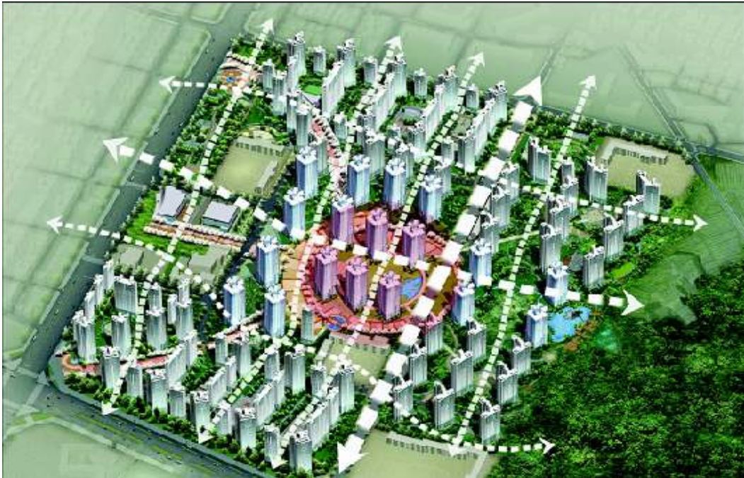
<둔촌주공아파트 재건축 조감도>